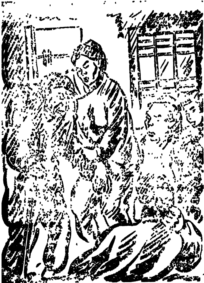
"ಮುನುಕಿಯ ದೋಷಕ್ಕೆ, ಕೊನೆವೊಪಲ್ಪಿದಾಯಿತು ___ ಆದಳನ್ನು ಸಮಾಧಾನಪಡಿಸಲಾಗಲಿಲ್ಲ" ಅನ್ನಿ ರೀ, ನಿಕ್ಕಿನಿಕ್ಕಿ, ಆಳಕೊಪಗಿವಳು.